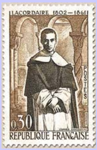
Timbre postal à l'effigie d'Henri Lacordaire 1961