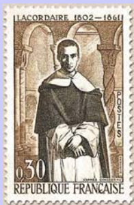
Timbre postal à l'effigie d'Henri Lacordaire 1961